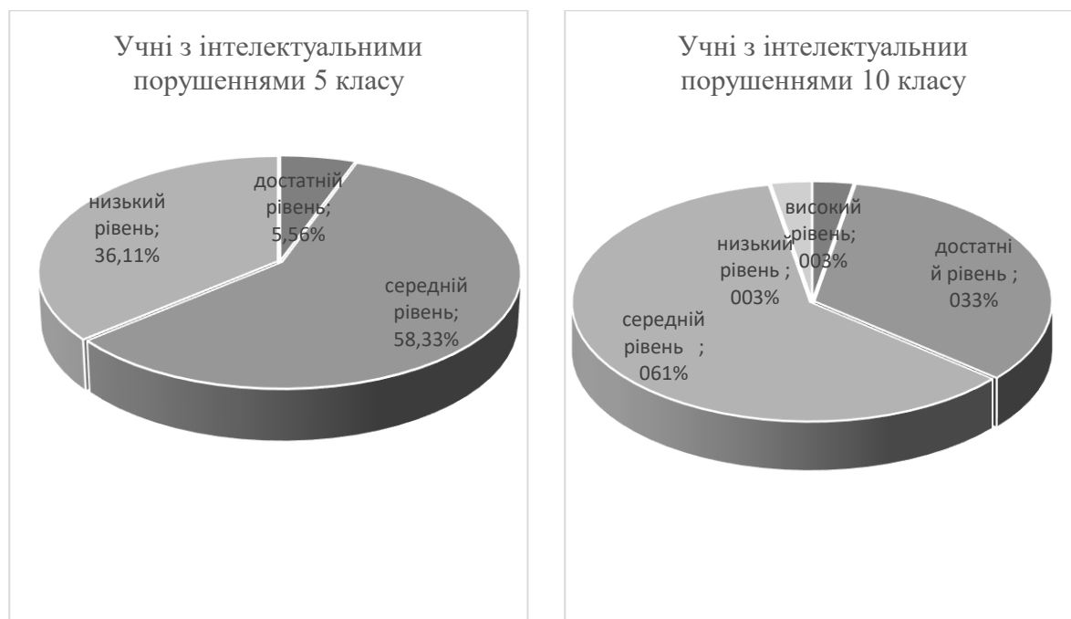
Рис. 1. Порівняльний кількісний аналіз рівня сформованості соціально-побутових навичок у старшокласників з інтелектуальними порушеннями за усіма компонентами та показниками (дані подано у %)

Результати аналізу відповідей вчителів, вихователів та батьків на запитання щодо рівня сформованості соціально-побутових навичок у старшокласників з інтелектуальними порушеннями були наступні: