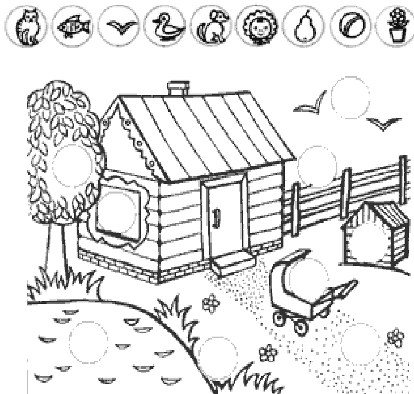
Рис. 2 Стимульний матеріал до методики "Де чие місце?".

Біля всіх зображених предметів розташовані порожні кружечки. Для гри також знадобляться такі ж за величиною кружечки, але вже з намальованими на них фігурками. Всі зображені в кружечках фігурки мають своє певне місце на картинці.